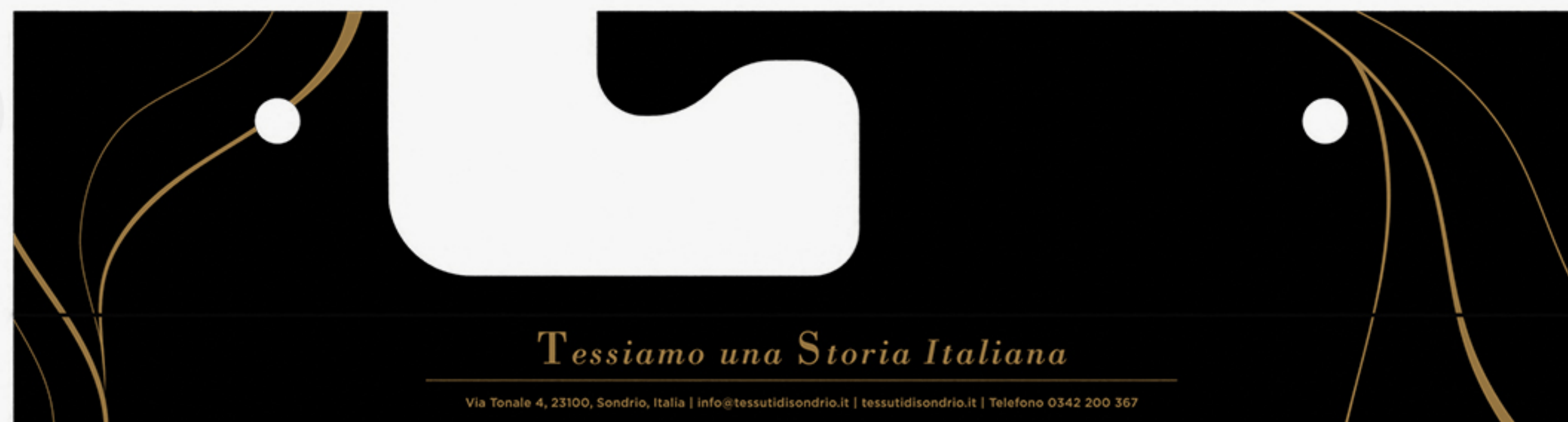
VISIONE FRONTALE E POSTERIORE APPENDINO (FORMATO CHIUSO 34X9CM)