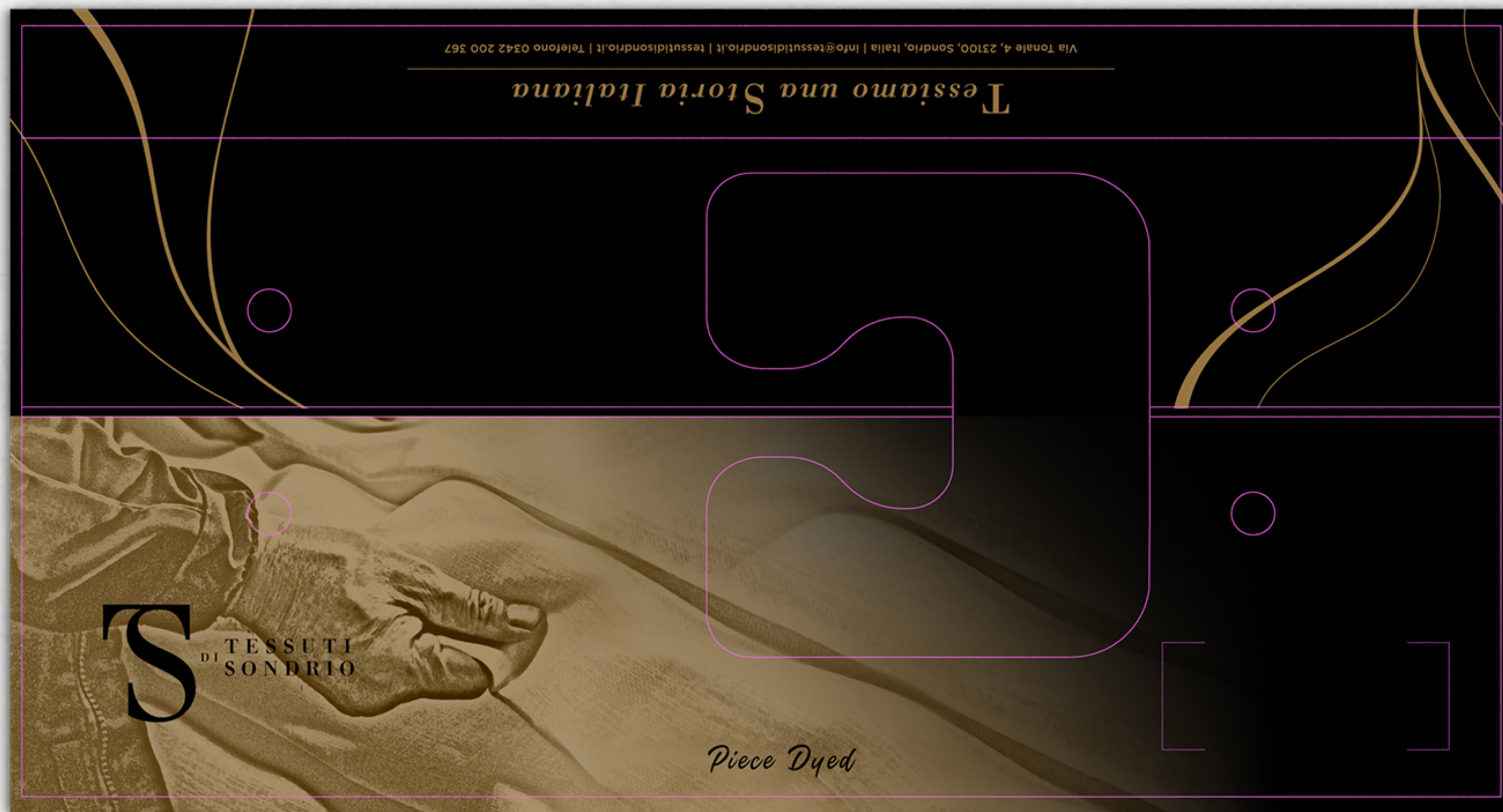
VISIONE FRONTALE: STAMPA IN SOLA BIANCA (FORMATO APERTO 34X18CM)